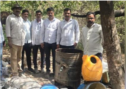
दिली जाणार नसल्याचे विभागाने सांगितले आहे. अवैध मद्यनिर्मिती, साठवणूक किंवा विक्रीबाबत कोणतीही माहिती अथवा तक्रार असल्यास नागरिकांनी तत्काळ राज्य उत्पादन शुल्क विभागाच्या हेल्पलाईनशी संपर्क साधावा, असे आवाहन करण्यात आले आहे.

मद्यसाठी आणि रसायने जप्त करण्यात आली. विभागाने १,५७६ बॉक्स लिटर देशी दारू, ४८४ लिटर हातभट्टी/गावठी दारू तसेच सुमारे ४५ लिटर ताडी जप्त केली आहे. याशिवाय मानवी आरोप्यास घातक ठरणारे आणि अवैध दारू निर्मितीसाठी वापरले जाणारे ३,०७० लिटर रसायन जप्त करून जागेवरच नष्ट करण्यात आले. राज्य उत्पादन शुल्क विभागाच्या माहितीनुसार या कारवाईत एकूण ३.५८ लाखांहून अधिक किमतीचा मुद्देमाल जप्त करण्यात आला आहे. यात मद्य, रसायने, वाहने आणि इतर साहित्याचा समावेश आहे. विभागाने स्पष्ट केले आहे की, अवैध मद्य व्यवसायाविरुधातील ही मोहीम पुढेही अधिक तीव्रतेने सुरू राहणार असून उत्पादनापासून विक्रीपर्यंतच्या संपूर्ण साखळीवर कारवाई केली जाणार आहे. बेकायदेशीर कृत्यांना कोणतीही मुभा