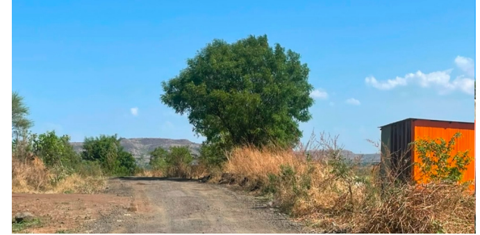
खुलताबाद परिसर मंदीर व पर्यटनस्थळ होत असल्याने येथे दररोज कामगारांची सुद्धा ये-जा असते. कामगारांसह मालाची ये-जा करणारी मालवाहू वाहने सुद्धा या रस्त्यावरून रात्रंदिवस धावतात.

शेतमालाचे व्यापारी मोठ्या प्रमाणात आहे. शिवाय आठवड्यातून वेरूळ खुलताबाद येथे आठवडी बाजारसाठी दोन दिवस या ठिकाणी भाजी मंडई भरत असल्याने परिसरातील भाजी उत्पादक या ठिकाणी येतात. याशिवाय दैनंदिन गरजेच्या वस्तूंसह शेतमालासाठी अत्यावश्यक असणारी औषधी, कीटकनाशके व खतांसाठी खुलताबाद वेरूळ ही दोन गावे अत्यंत उपयोगी मानल्या जाते. याशिवाय परिसरातील ५ ते ७ गावांसाठी घुणेश्वर मंदीर वेरूळ तहसील कार्यालय खुलताबाद. येथे शाळा, महाविद्यालय व दवाखाने असल्याने रुग्णांसह विद्यार्थी व गावकऱ्यांची मोठ्या प्रमाणात ये-जा असते. विशेष म्हणजे वेरूळ व