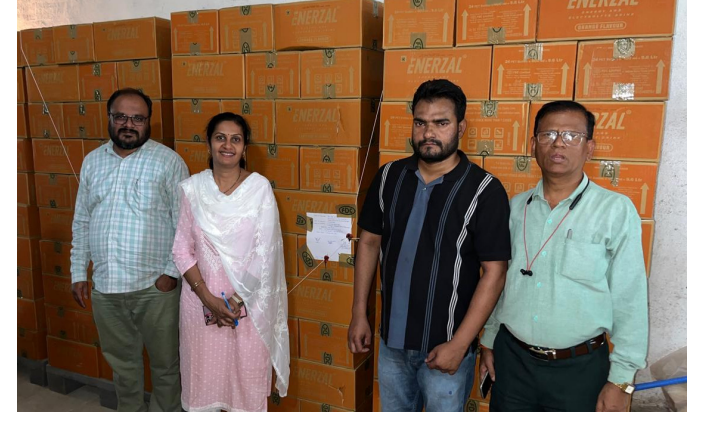
'आरटीएस फ्रूट बेव्हरेज एनर्जी अँड इलेक्ट्रोलाइट (एछएन-ड)' या पेयाच्या ४०० मिली क्षमतेच्या एकूण ३६ हजार ४६८ बाटल्या साठवून ठेवण्यात आल्याचे आढळून आले.