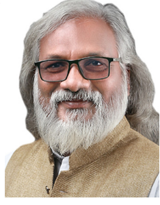
अनुसूचित जाती च्या एकूण ५८ जातीच्या समूहाने उपवर्गीकरण रद्द करण्यासाठी जिल्हा बीड जिल्ह्यातून १०